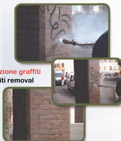
Rimozione graffiti Graffiti removal