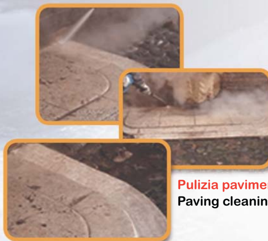
Pulizia pavimenti con vapore Paving cleaning with steam