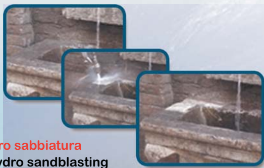
Idro sabbatura Hydro sandblasting